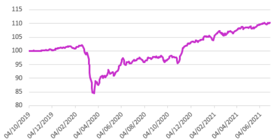
Performance du fonds