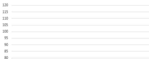
Performance du fonds