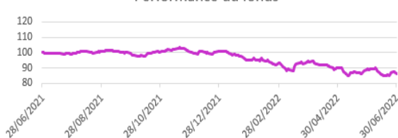
Performance du fonds