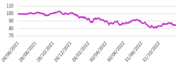
Performance du fonds