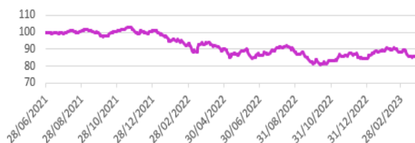
Performance du fonds