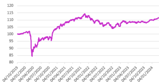
Performance du fonds