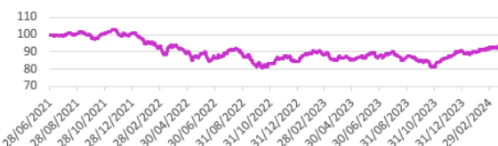
Performance du fonds