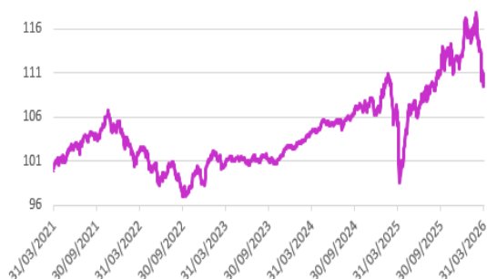
Performance du fonds sur 5 ans